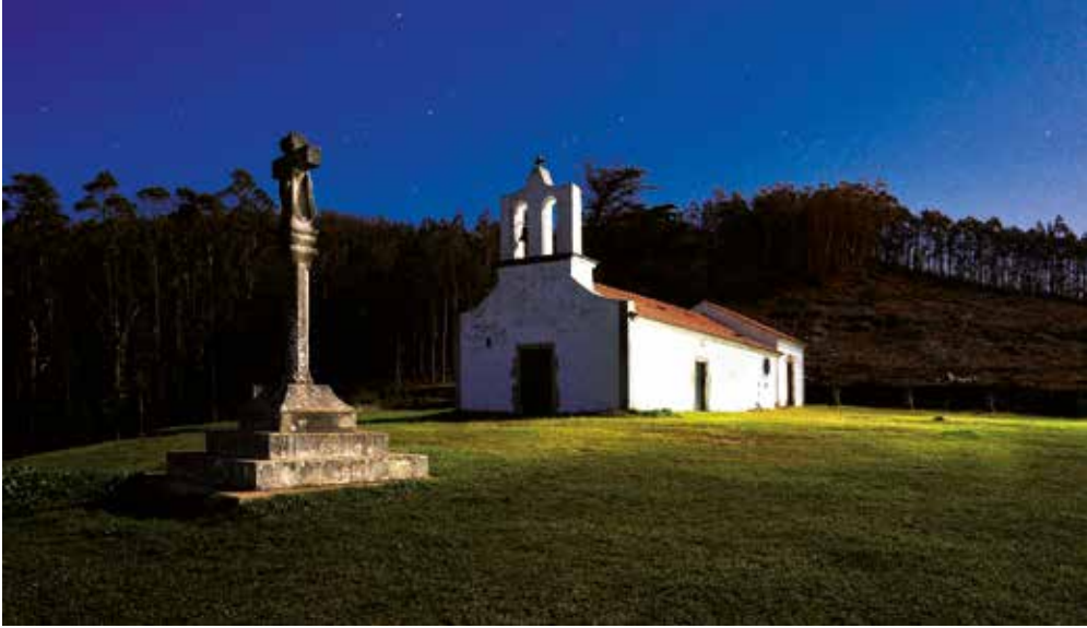
■ Ermita de Corveiro.

tísticas figuras que el viento y la erosión han dejado en las rocas del bosque de piedra.