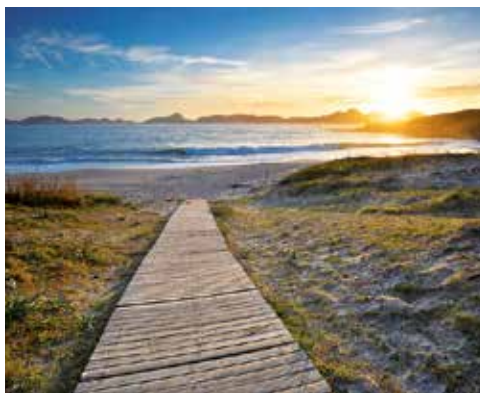
Playa de Melide y cabo de Home, en Cangas. ■

Nuestro objetivo es dar a conocer la esencia de los pueblos con encanto, tranquilos, pequeños y lejos del ajetreo de las ruidosas y apresuradas ciudades.