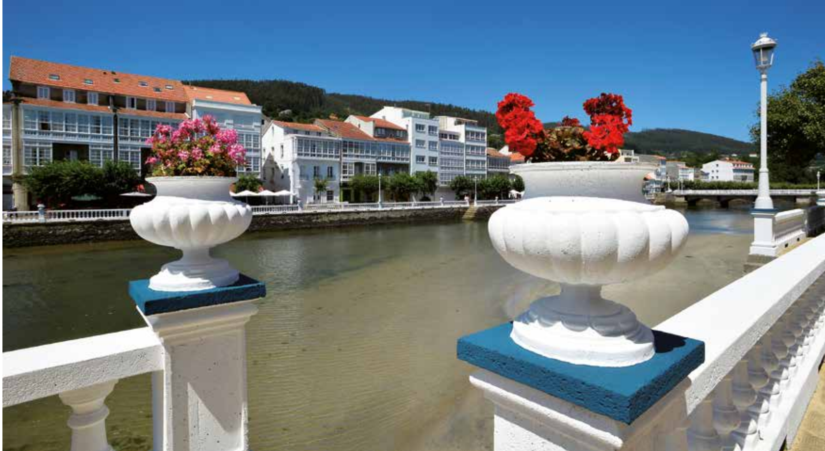
Cedeira y el río Condomiñas. ■

El padre Sarmiento se refería a él en el año 1703 como un diminuto monasterio, bajo la protección de los condes de Traba, al borde de