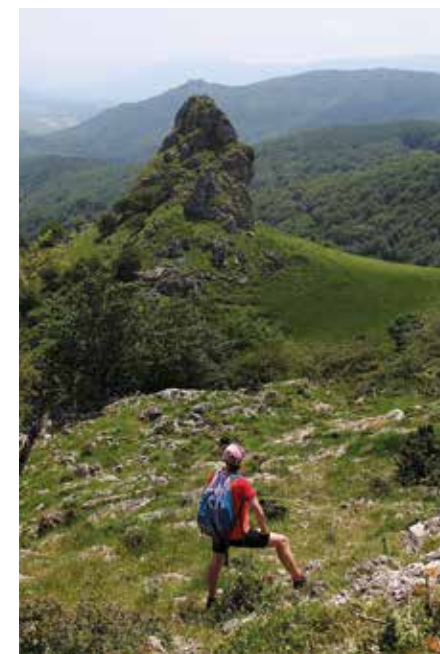
La aguja de Naparraitz desde la cumbre de Bikunaitz.

Descendemos hasta las inmediaciones del caserío Andikoetxe y por la pista de hormigón regresamos al puerto de Otzaurte.