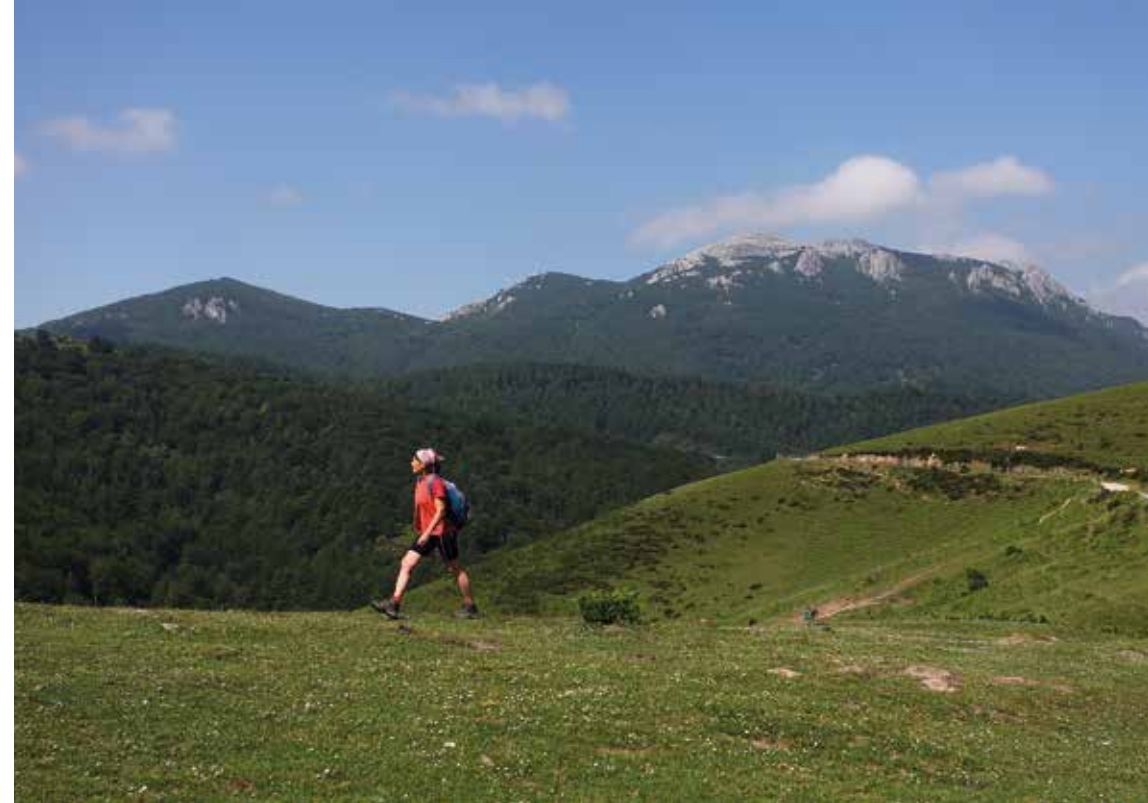
Aratz domina el paisaje sobre los prados de Ultzama.

las plantaciones de abeto rojo y el hayedo natural.