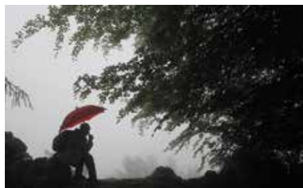
Descansando en el hayedo.

Cuando hayamos recorrido el macizo y tras disfrutar de un colosal almuerzo de montaña, iniciaremos el regreso al collado de Zorrospespe por la misma ruta.